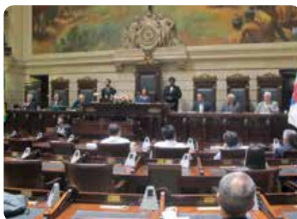
Solenidade aconteceu no Palácio Pedro Ernesto, na Câmara de Vereadores d