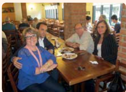
Membros do Conselho e colegas médicos veterinários estiveram presentes

No dia 11 de setembro aconteceu o tradicional almoço de confraternização, em comemoração ao Dia do Médico Veterinário, realizado no restaurante À Mineira, em São Francisco, Niterói.