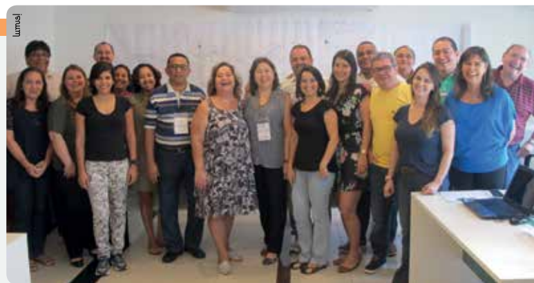
Representantes de CRMVs de todo Brasil estiveram presentes