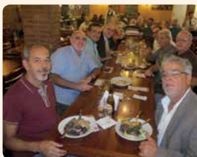
O almoço já é tradicional e reúne profissionais na semana da comemoração do Dia do Médico Veterinário

O CRMV-RJ parabeniza a todos os profissionais da área pelo seu dia!