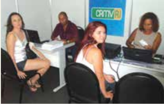
Atendimento na Casa do Médico Veterinário e Zootecnista em Itaperuna, realizada entre 13 e 15 de março