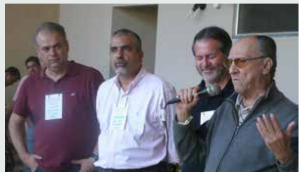
III Encontro de Ex-alunos da faculdade de Veterinária da UFF