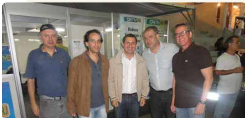
Casa do Médico Veterinário e Zootecnista em Cordeiro entre os dias 18 e 20 de julho contou com a presença do secretário de Estado de Desenvolvimento Regional, Abastecimento e Pesca, Felipe Peixoto.