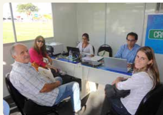
Atendimento realizado na Casa do Médico Veterinário e Zootecnista em Campos entre os dias 04 e 06 de julho.