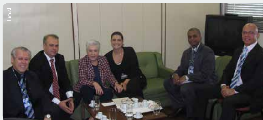
Reunião realizada na sede do Procon-RJ

“Estamos preparando um termo de cooperação técnica para que cada instituição atue em parceria, mas de acordo com suas atribuições. Tenho certeza que podemos