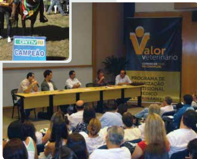
Mesa Redonda sobre Leishmaniose realizada em dezembro de 2012 na Barra