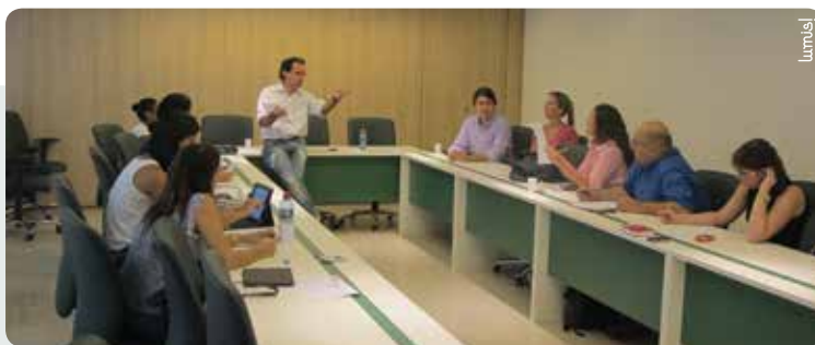
Encontro reuniu empresas parceiras para definição do Valor Veterinário 2013

Os dois últimos eventos do Valor Veterinário realizados pelo CRMV-RJ fizeram sucesso. Em novembro de 2012, o Seminário Estadual de Ensino da Medicina Veterinária e suas conexões com o mercado de trabalho abordou o cenário atual do ensino da Medicina. Enquanto que, em dezembro do ano passado, foi promovido a Mesa Redonda sobre Leishmaniose no Centro de Convenções Barra Shopping.