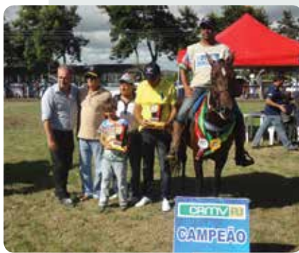
Casa do Médico Veterinário e Zootecnista realizado em Araruama no início do ano