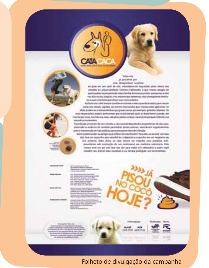
Folheto de divulgação da campanha