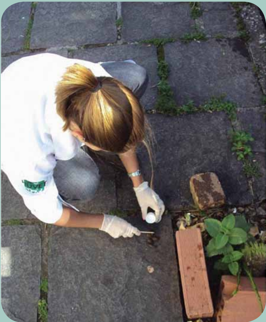
Coleta nas ruas de Niterói