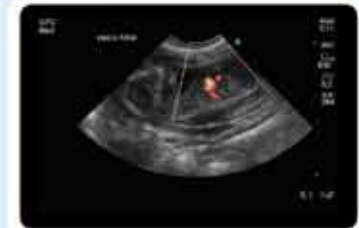
vascularização feto 45 dias

Internação referenciada: ética e profissionalismo dedicados ao Médico Veterinário