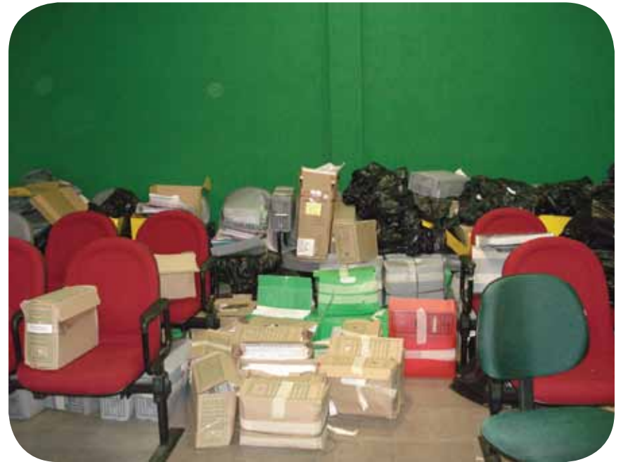
A atual sede do CRMV-RJ está lotada de arquivo de documentos. Não há hoje espaço suficiente para armazenamento de todo acervo do Conselho