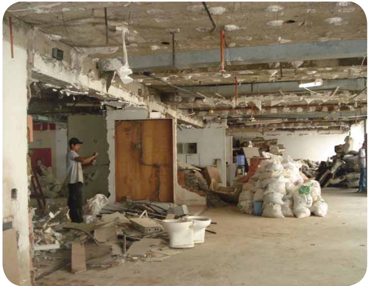
Todo o andar está sendo reformado para sediar o CRMV-RJ

O Contrato firmado com a construtora responsável prevê a conclusão da reforma em meados de 2011. Veja abaixo as fotos desse início das obras. Ao longo do processo, publicaremos o andamento da obra até a tão aguardada inauguração da nova sede do CRMV-RJ.