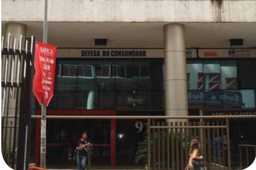
Fachada do prédio que abrigará a nova Sede do CRMV-RJ , localizado na Rua da Alfândega, 91 14º andar. O local é de fácil acesso no Centro do Rio através de ônibus, metrô, trem e barcas. Essa numeração é bem próxima a estação Uruguaiana do Metrô do Rio.