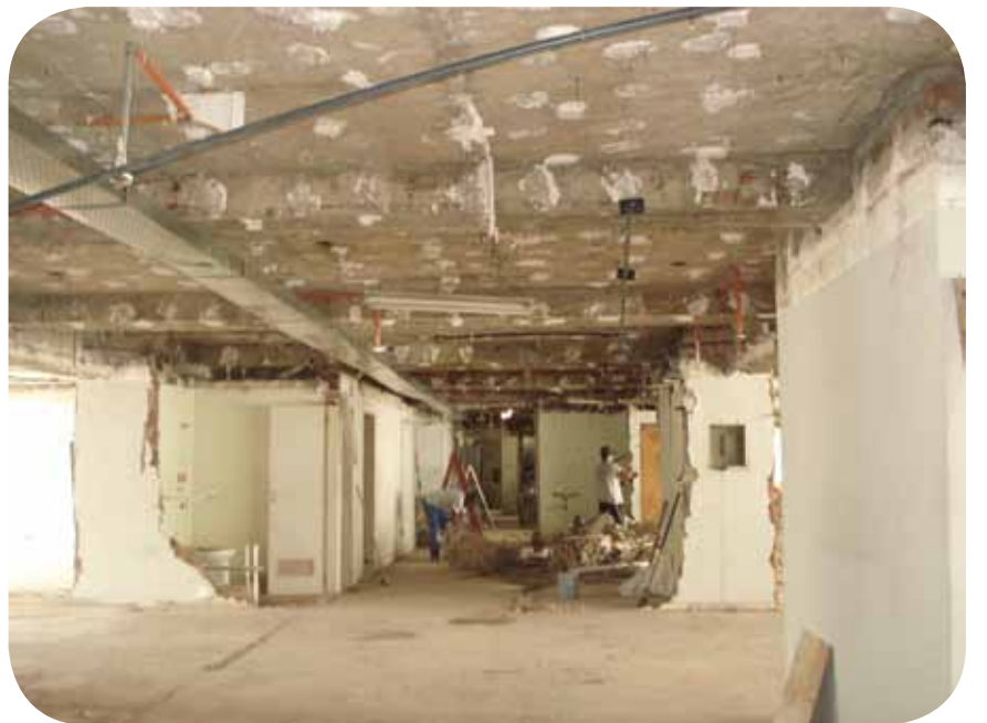
Todo o andar está sendo reformado para sediar o CRMV-RJ