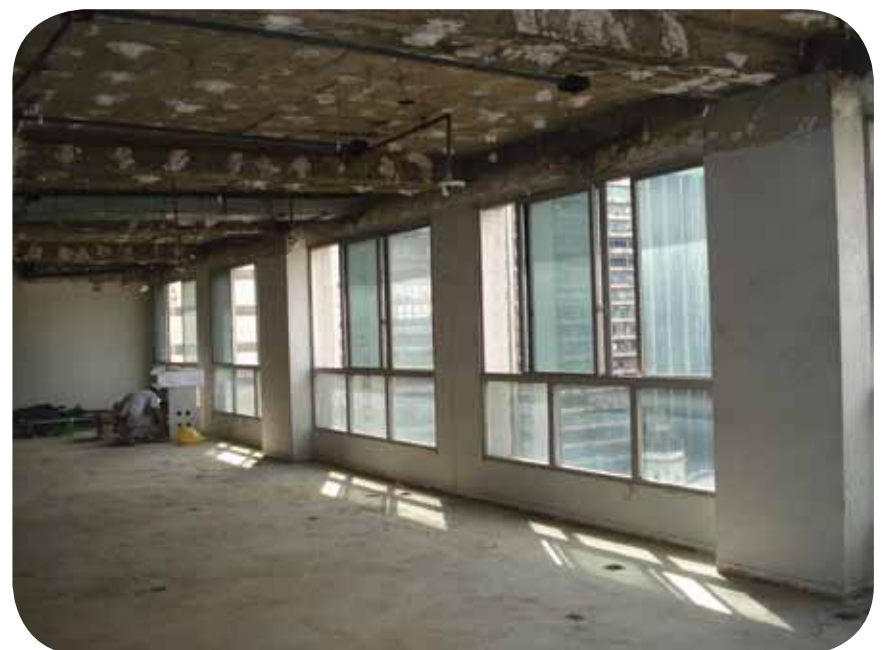
Amplio espaço para desenvolver as atividades do CRMV-RJ. Todo o andar é rodeado de janelas que garantem a ventilação e a luminosidade do local.