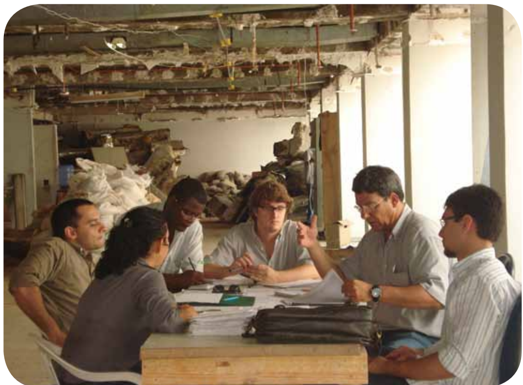
Equipe responsável pelo projeto e execução da obra